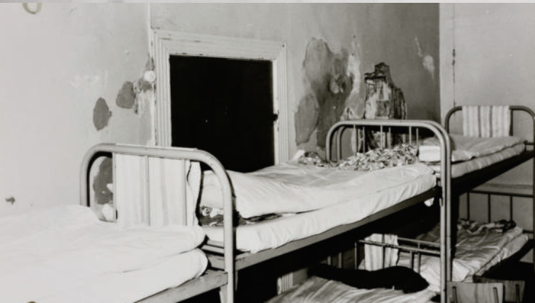
Schlafraum der Kinderstation im Psychiatrischen Pflegeheim in Dobbetin in den 1980er Jahren