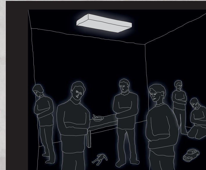
Die Situation von sechs jungen Menschen im Feierabend- und Pflegeheim in Hohenlanke Ende der 1980er Jahre

Die aus 13 Rollbannern bestehende Wanderausstellung zeigt das Leben von Kindern und Jugendlichen mit geistigen und körperlichen Behinderungen auf. Dabei werden vor allem ihre Unterbringung, ihre Betreuung, ihre Integration, die Bildungs- und Therapieangebote in staatlichen und konfessionellen Einrichtungen sowie die gegen sie gerichteten Zwangsmaßnahmen thematisiert. Ebenso wird die häusliche Pflege in den Blick genommen. Sechs Einzelschicksale dokumentieren die Lebenswelten von Mädchen und Jungen mit unterschiedlichen Behinderungen. Grundlegende Quellen dieser Ausstellung sind Sekundärliteratur, Publikationen aus der Schriftenreihe der Landesbeauftragten, Unterlagen aus dem Landeshauptarchiv und aus Privatarchiven sowie Zeitzeugeninterviews.