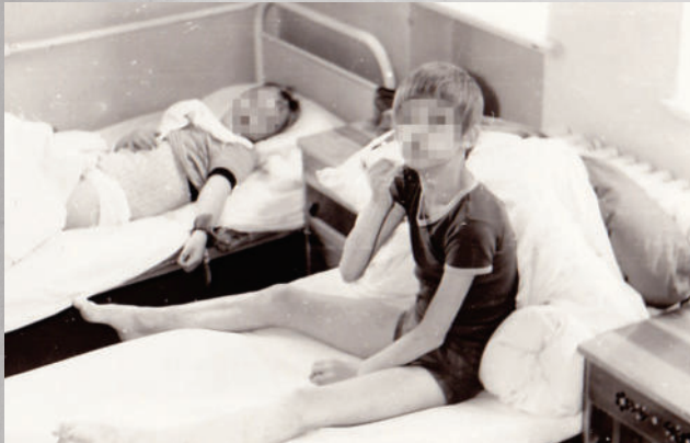
Aufnahme von Kindern des evangelischen „Clara-Dieckhoff-Heim“ in Güstrow, hier 1979 in Nienhagen

Menschen mit Behinderung waren in der DDR jederzeit eine Randgruppe der Gesellschaft. In der DDR-Verfassung aus dem Jahr 1968 wurde zwar verankert, dass „jeder Bürger der Deutschen Demokratischen Republik [...] das Recht auf Fürsorge der Gesellschaft im Alter und bei Invalidität“ hat, doch zwischen den Rechten und dem tatsächlichen Leben behinderter Menschen existierte ein markanter Widerspruch. Das betraf auch die Lebenssituation von behinderten Kindern und Jugendlichen in den ehemaligen drei Nordbezirken.